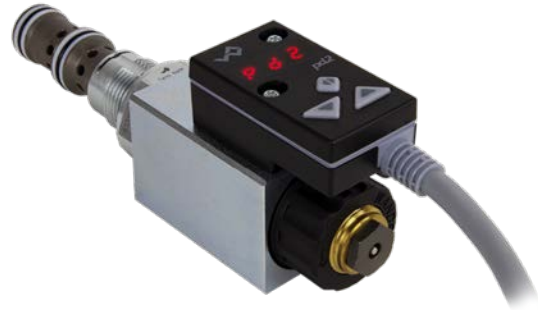
Sur électro-aimant MP