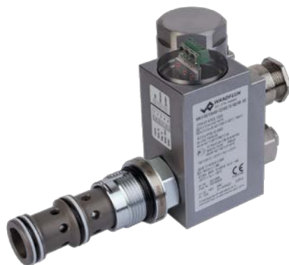
Exécution antidéflagrante M248

Grâce aux signaux dither (battement) spécialement réglés dans l'amplificateur, la famille PD2 aboutit à une stabilité excellente et une hystérese fortement réduite sur les valves. Les modules amplificateurs peuvent alors être paramétrés soit par le panneau de commande interne, ou à l'aide du logiciel de paramétrage PASO à utilisation intuitive. L'interface utilisateur de ce logiciel est construite en schéma bloc. Un clic sur le symbole respectif ouvre la fenêtre correspondante, dans laquelle les paramètres se laissent très facilement et clairement régler. En plus du choix de différents types de signaux, des générateurs de rampe avec des courbes de rampe adaptables individuellement peuvent aussi être programmées. Il n'y a presque pas de limite aux nombreuses possibilités de paramétrage avec ou sans le logiciel PASO.